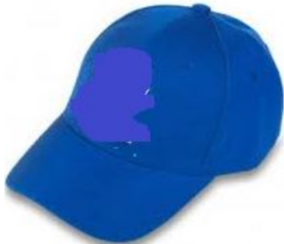
Шапка тип бейзболна за летен комплект