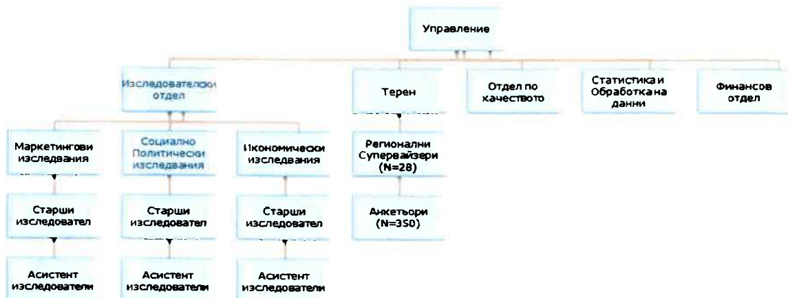
Фиг. 1: Организационна структура на Алфа Рисърч

Алфа Рисърч поддържа собствена анкетърска мрежа, която покрива цялата територия на страната. Анкетърската мрежа се състои от над 300 обучени анкетъори под контрола на 28 регионални супервайзери. (виж Фигура 2).